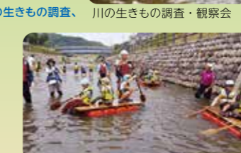
大栗川水辺まつり