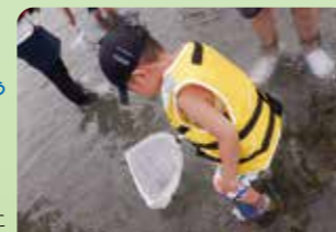
水生生物をつかまえて水質をしらべよう

《今後の活動予定》 4月11日(日) バードウォッチング&ごみ拾い 5月 9日(日) 水生生物をつかまえて水質をしらべよう 6月13日(日) 多摩川で魚を見つけよう 7月11日(日) 誰でもできる簡単釣り体験 ※活動日時・内容は変更になる可能性があります。 また、参加には事前のお申込みが必要です。 詳細につきましては、今後、福生市ホームページに掲載します。