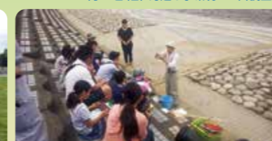
身近な水環境の一斉調査

※新型コロナウイルス感染症拡大の影響等により中止とする場合がありますので、実施の有無については各団体にお問合せください。 ※全体のレイアウトはイメージです。場所を特定するものではありません。