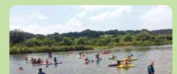
水難訓練とカヌー教室・イカダ遊びの風景

子どもたちがカヌーやイカダで楽しく遊びながら川の自然を体験したり、多摩川にすむ魚を観察しながら安全に水に触れ合えるよう毎年夏にカヌー教室、春と秋には、市内の公立学校の学習支援として、野草観察を実施しています。