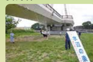
浅川で遊ぼう1(ターザンロープ)

浅川潤徳水辺の楽校では、日野市の母なる川「浅川」を中心に年20回ほどの楽しい活動を実施しています。