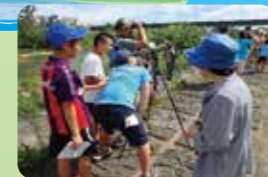
水辺のかんきょう教室