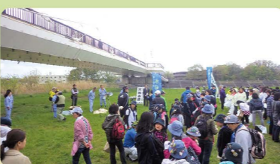
4月24日(日)多摩川・浅川クリーン作戦に参加