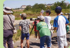
水辺のかんきょう教室

【令和4年度事業予定】 6月 ウグイの放流 8月上旬 ガサガサ探検隊 9月上旬 水辺のかんきょう教室 1~3月 浅川河川清掃と野鳥観察 (会員のみを対象とした事業も含まれます)