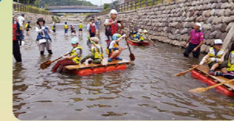
大栗川水辺まつり