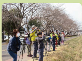
3月12日(土)「浅川」で野鳥観察

浅川潤徳水辺の楽校では、日野市の母なる川「浅川」を中心に年20回ほどの楽しい活動を実施しています。