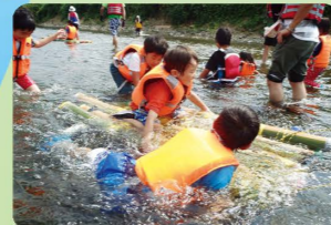
令和元年度 いかだで冒険、多摩川で泳ごうの様子

「福生水辺の楽校」では、子どもたちが多摩川の自然とふれあう場として、水辺の楽校「多摩川で遊ぼう」「多摩川サポーターズ」を開催します。水辺の植物や生物、野鳥などの観察を通して、多摩川の自然を子どもたちに体感してもらっています。