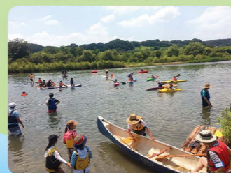
水難訓練とカヌー教室・イカダ遊びの風景

子どもたちがカヌーやイカダで楽しく遊びながら川の自然を体験したり、多摩川にすむ魚を観察しながら安全に水に触れ合えるよう毎年夏にカヌー教室、春と秋には、市内の公立学校の学習支援として、野草観察を実施しています。