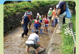
大丸用水内での観察

※新型コロナウイルス感染症拡大の影響等により中止とする場合がありますので、実施の有無については各団体にお問合せください。 ※全体のレイアウトはイメージです。場所を特定するものではありません。