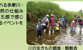
川の生きもの調査・観察会

毎月第1日曜日 大栗川の川ごみ清掃 6月 川の生きものの調査・観察会 多摩川と大栗川の合流点付近での生きもの調査、ガサガサ 7月 大栗川水辺まつり いかだ遊び、川遊び、ガサガサ 8月 乞田川の恵み 生きもの調査、ガサガサ 2月 冬鳥観察会 多摩川、大栗川での野鳥観察