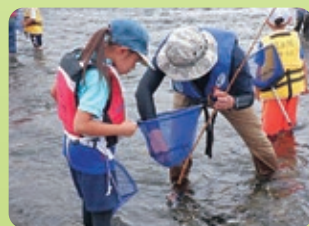
令和6年度 誰でもできる簡単釣り体験

「福生水辺の楽校」では、子どもたちが多摩川の自然とふれあう場として、水辺の楽校「多摩川で遊ぼう」「多摩川サポーターズ」を開催します。水辺の植物や生物、野鳥などの観察を通して、多摩川の自然を子どもたちに体感してもらっています。