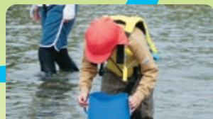
小魚を箱メガネでみつめています