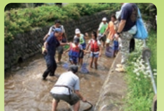
大丸用水内での観察

※実施の有無については各団体にお問合せください。 ※全体のレイアウトはイメージです。場所を特定するものではありません。