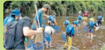
川の生きもの調査・観察会