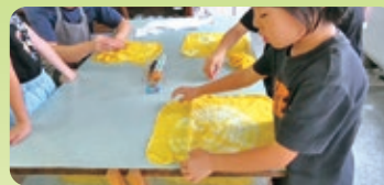
育てた「マリーゴールド」で染物体験 どんな模様ができるかな?