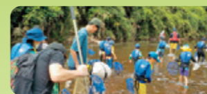
川の生きもの調査・観察会

【令和6年度の主な活動予定】 毎月第1日曜日 大栗川の川ごみ清掃 6月 川の生きもの調査・観察会 生きもの調査、ガサガサ 8月 乞田川の恵み 生きもの調査、ガサガサ 2月 冬鳥観察会 多摩川、大栗川での野鳥観察 6月~10月 総合学習時間の支援