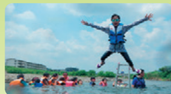
浅川プールでジャンプ