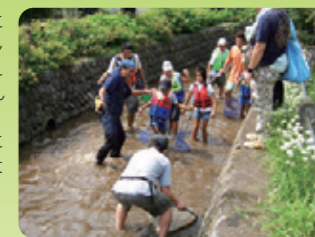
大丸用水内での観察

「いなぎ水辺の楽校」は、子どもたちが安全に楽しく多摩川を利用できるようルールを理解し身につけてもらうこと、さらには自然とのふれあいのなかで自然の大切さや不思議さを学んでもらうことを目標としています。 現在は活動を休止しておりますが、多摩川に通じる大丸用水に生息する生き物を調べる「大丸ガサガサ探検隊」という企画もあります。