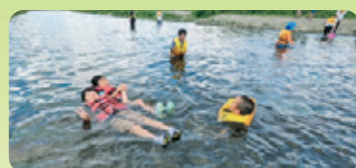
2023年8月27日(日) 浅川・川遊びの様子