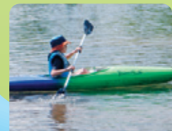
水難訓練とカヌー教室・イカダ遊びの風景