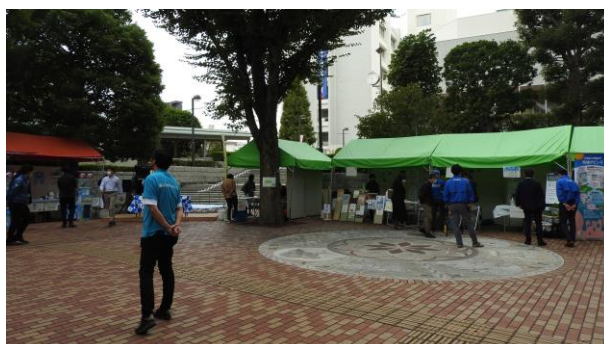
調布市役所の前庭には、例年通り計25団体のブースが並びました。