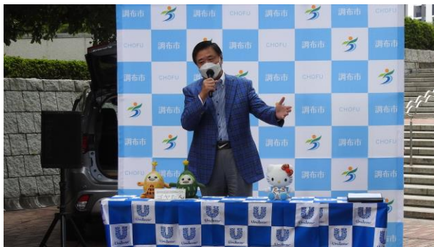
午前10時。開会式で挨拶をする長友市長。