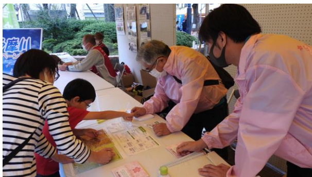
時間に余裕がある来場者には、 実際に水質調査を疑似体験してもらう等、 環境を身近に感じてもらう工夫もしました。