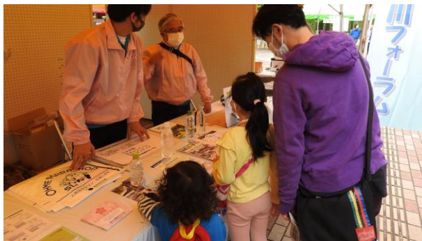
当ブースにもたくさんの来場者があり、 小さなお子さん連れの親子も目立ちました。