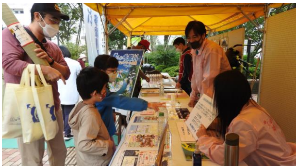
多摩川一斉水質調査等、当フォーラムの 活動内容が簡単にわかるクイズを出題して 楽しんでもらいました。