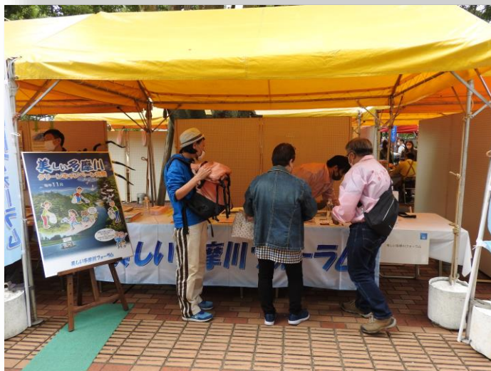
2022年10月22日(土)、調布市役所前庭にて

2022年10月22日(土)、美しい多摩川フォーラムでは、調布市役所の前庭で3年ぶりに開催された「第50回調布市環境フェア」にブース出展しました。