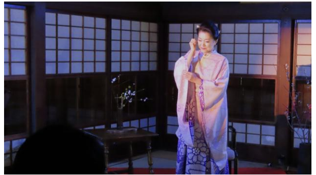
いよいよ「語り」が始まりました。