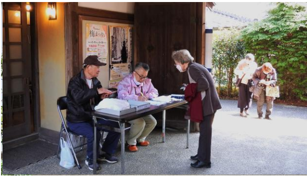
午後1時半より受付開始。 続々と参加者がいらっやいます。