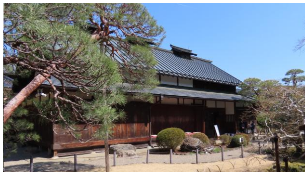
会場の主屋は明治初期に建てられ、 国の登録有形文化財。